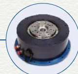
有框直接驱动旋转电机