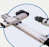
多轴精密定位平台