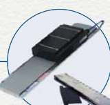
直接驱动直线电机